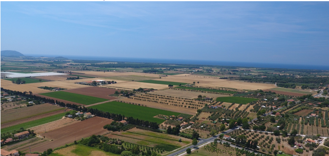
Nella foto la pianura coltivata della Val di Cornia nei pressi di Venturina Terme

Il PSI in via di adozione si compone di relazioni, norme e cartografie accessibili al pubblico attraverso la pagina dedicata dei siti istituzionali dei due Comuni, oltre al rapporto del garante dell'informazione e della partecipazione nel quale sono illustrate le attività di partecipazione, di varia natura e coinvolgimento, svolte nel corso di formazione del nuovo strumento di pianificazione.