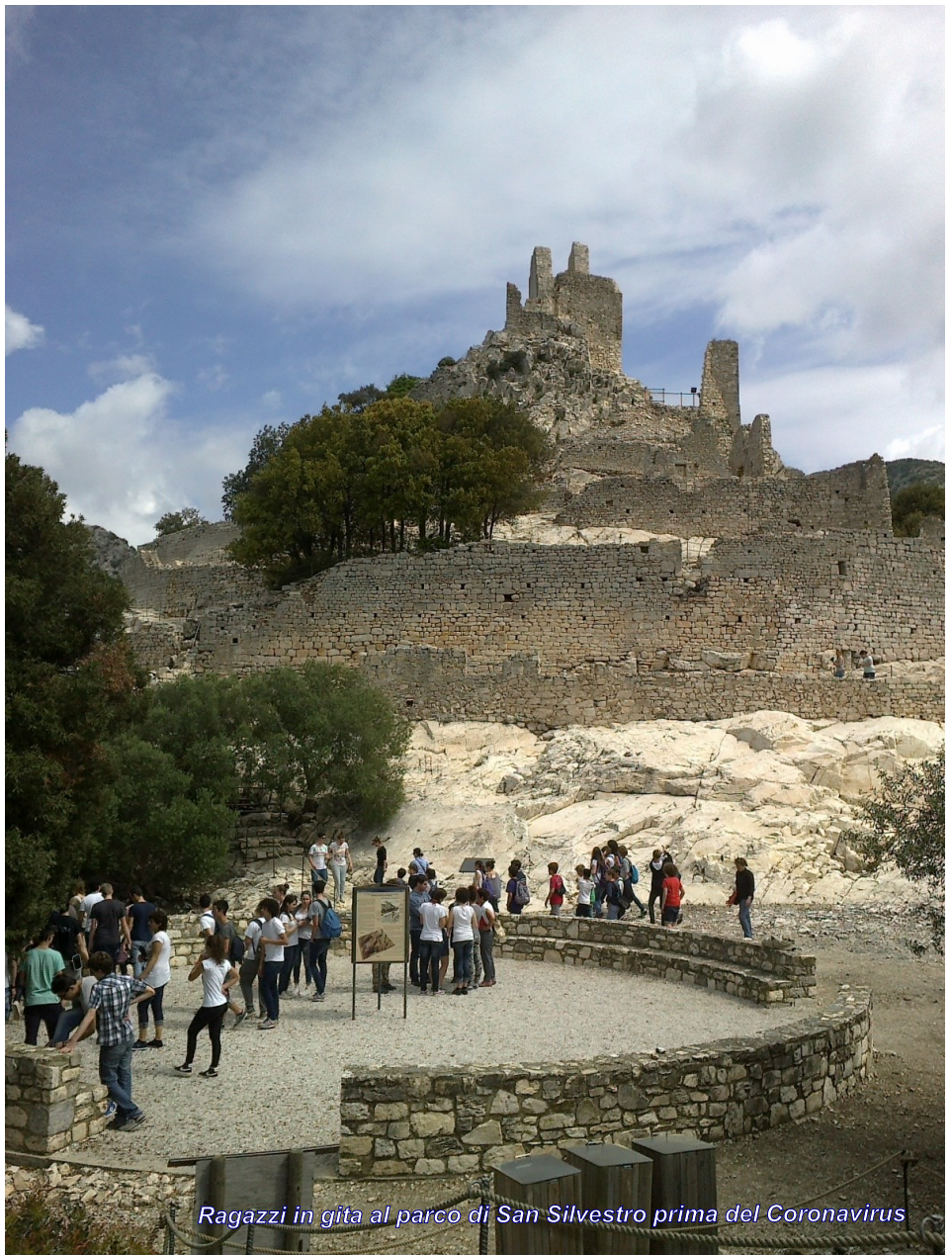
Ragazzi in gita al parco di San Silvestro prima del Coronavirus

Il programma di dettaglio è consultabile alla pagina http://www.parchivaldicornia.it/it/proposte-per-la-scuola ed è possibile prenotare contattando l'ufficio prenotazioni della Parchi Val di Cornia SpA al tel. 0565 226445 o via email prenotazioni@parchivaldicornia.it