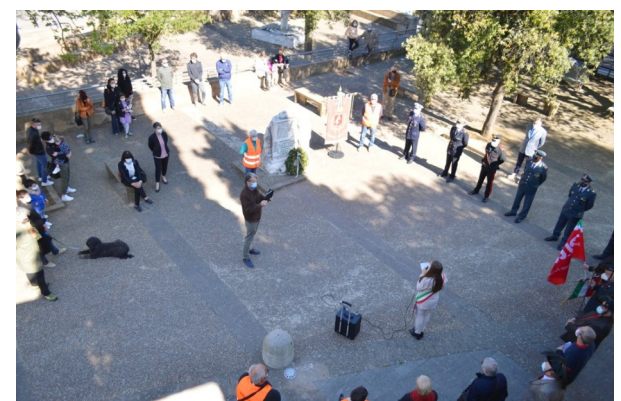
Nelle foto, momenti della celebrazione