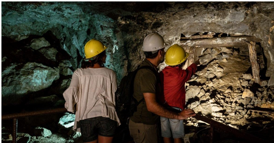
Nelle foto visitatori all'interno della miniera del Temperino, nel parco archeominerario di San Silvestro e il villaggio di Rocca San Silvestro

San Silvestro, Baratti e Populonia pronti ad accogliere gli ospiti che dovranno obbligatoriamente prenotare entro il giorno precedente la visita