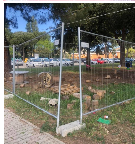
Nelle foto il vetro rotto alla cucina del Nido e l'aula esterna danneggiata alla Scuola dell'infanzia.