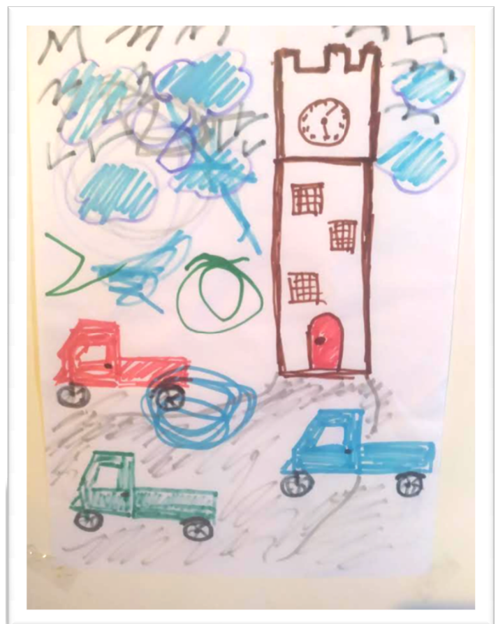
Sopra, un disegno dei bambini nella passata edizione di "Dipingi un agolo di Campiglia" e a sinistra l'articolo su un quotidiano del 1967