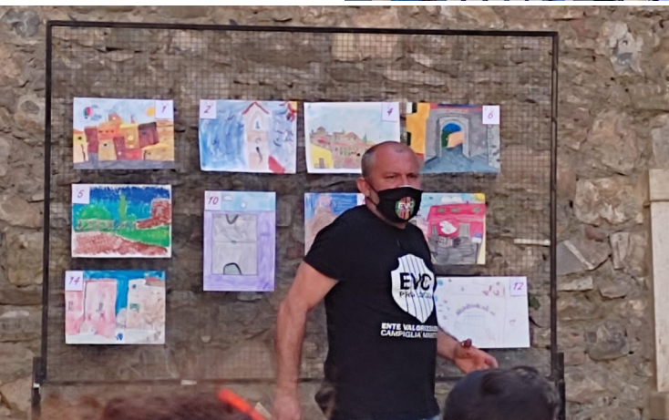
Nelle foto alcuni momenti dell'Estemporanea di pittura con i partecipanti e la giuria.