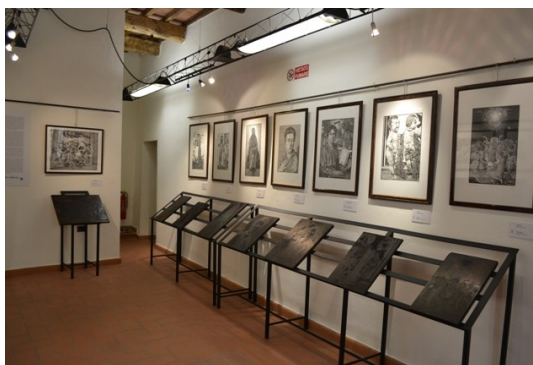
Nella foto a fianco una delle sale del Museo Guarnieri dedicate alla xilografia. Sotto, il complesso monumentale della Rocca di Campiglia

La biblioteca è gestita da Sefi Srl, società in house del comune di Campiglia Marittima