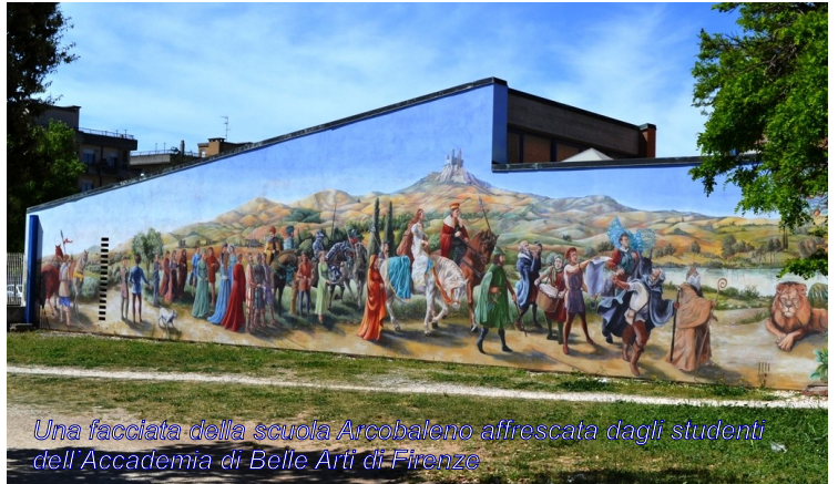
Una facciata della scuola Arcobaleno affrescata dagli studenti dell'Accademia di Belle Arti di Firenze

Il progetto prevede anche il montaggio di linee vita sulla copertura, la sostituzione di alcuni infissi e la sostituzione di alcuni elementi interni all'edificio.