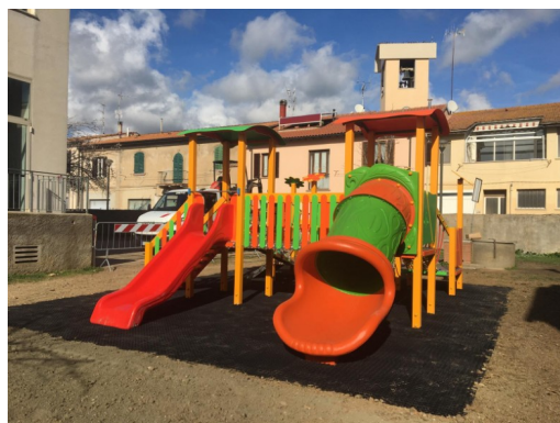
Nelle foto alcune immagini delle attività dello scorso anno e i vari giardini attrezzati delle strutture scolastiche