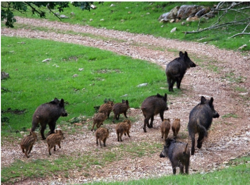
Nella foto a sinistra esemplari adulti e cuccioli di cinghiale

"Dall'analisi e dagli studi che abbiamo a disposizione, in particolare sui lupi, si evidenzia che nella maggior parte dei casi la soluzione più semplice e immediata non è quella che produce effetti a lungo termine. Forse avremmo potuto fare di meglio e di più nel corso degli anni, con lo sguardo volto alla tutela del nostro ambiente e territorio oltre che, ovviamente, della produzione, che non pensare alla tutela degli interessi economici con un atto di forza. Anche in questo caso, come nell'argomento 'lupi' dobbiamo fare ancora molta strada prima di comprendere effettivamente dove sta il problema. Quello degli ungulati è un problema che arriva da lontano, il mio vuole essere un appello e uno stimolo ricercare le migliori soluzioni per il futuro".