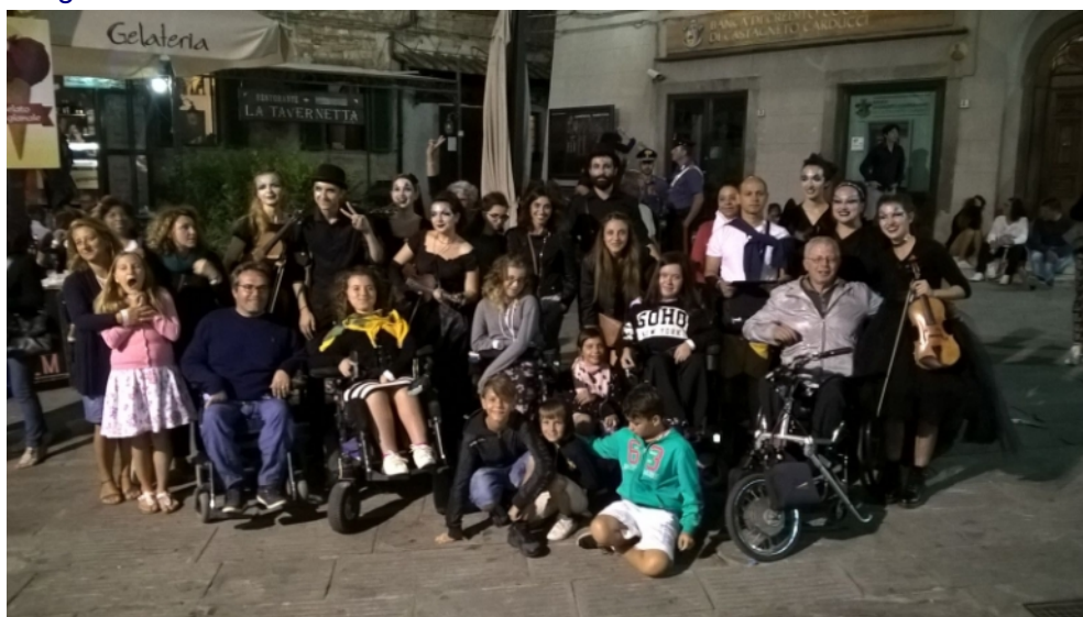
Una foto degli anni passati, il gruppo Uildm nel centro storico di Campiglia posa con gli artisti di Apritiborgo, manifestazione che i ragazzi non hanno mancato di visitare nel corso delle loro vacanze.