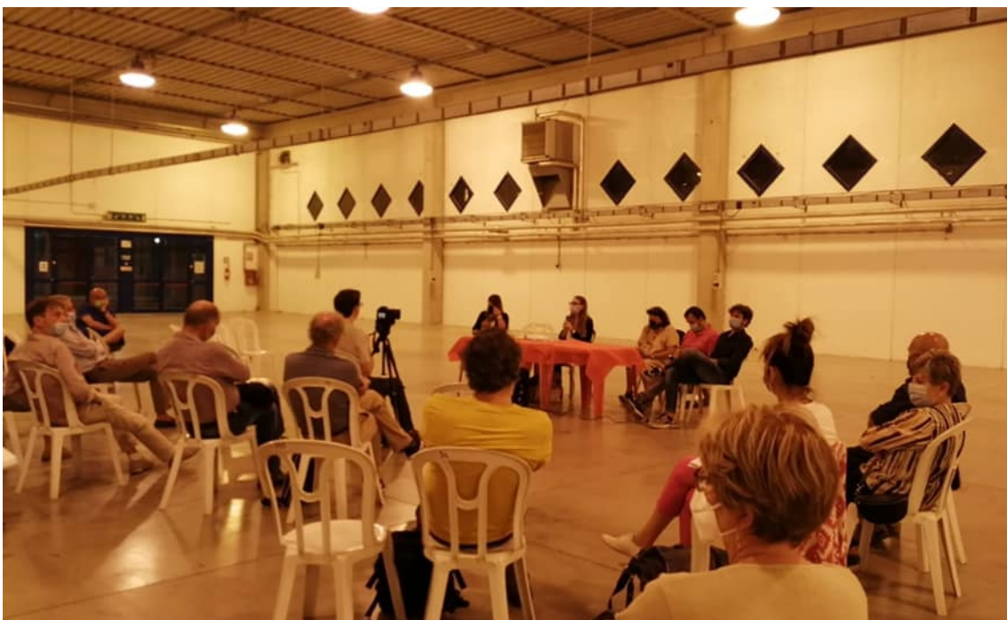
Un momento dell'incontro in presenza che si è svolto lo scorso 5 agosto

Inoltre si possono far pervenire anche contributi in forma scritta scrivendo per mail al settore assetto del territorio a: agiorgetti@comune.campigliamarittima.li.it , oppure un contributo scritto indirizzato a Comune di Campiglia Marittima, Via Roma n. 5 Ufficio Protocollo.