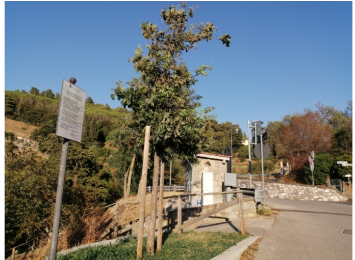
Nella foto la struttura che ospita le valvole automatiche

Sono state installate da Asa tra via 25 Luglio e viale Mussio, in prossimità dell'albero di Cecchino, delle valvole automatiche necessarie a ridurre la pressione nelle tubature idriche, così come prevede la legge per migliorare il servizio evitando sprechi e rotture. Le valvole sono alloggiare in una struttura in muratura che recentemente è stata anche oggetto di alcune critiche alle quali la sindaca Alberta Ticciati ha risposto chiarendo sia l'aspetto obbligatorio dell'impianto ai termini di legge, sia la localizzazione, anch'essa obbligata, del manufatto in murature e, inoltre, le caratteristiche costruttive di quest'ultimo che sono state determinate in armonia dei materiali da costruzione presenti nel centro storico. In queste pagine pubblichiamo una nota tecnica di Asa attraverso la quale si spiega come funzionano e a che cosa servono le valvole installate.